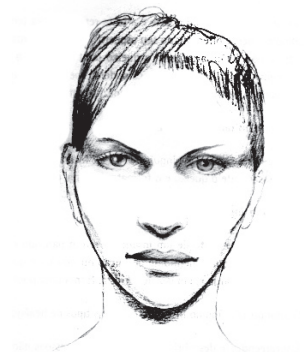
Fig5- Face com formato em losângulo, não muito frequente, também é característica das pessoas com personalidade sanguínea a força é representada pela proeminência do queixo. Narizes e grandes e projetados, olhos amendoados e espaçados também caracterizam estas pessoas.

EM CADA PESSOA PREDOMINA UM DOS QUATRO TEMPERAMENTOS, RESULTADO DE FATORES GENÉTICOS E INFLUÊNCIAS CULTURAIS, VARIANDO CONFORME SUA SITUAÇÃO E FASE DA VIDA. TODO SER HUMANO POSSUI AS QUATRO TENDÊNCIAS